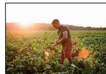
Voedsel dichtbij huis

Het energieloket wordt uitgebreid met een woonloket . Alle inwoners kunnen er terecht met vragen rond duurzaam bouwen, verbouwen, renoveren en energie. Deze loketten vormen ook het aanspreekpunt voor het aanvragen van bovenlokale premies in dit verband.