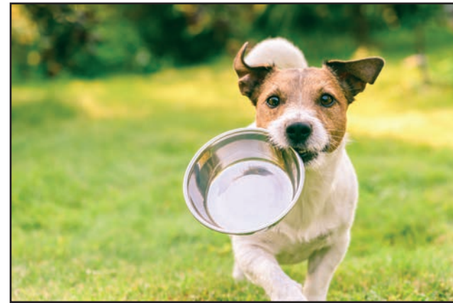
Ruimte voor onze dieren

Binnen de regio werken we mee aan de oprichting van een intergemeentelijk dierenasiel .