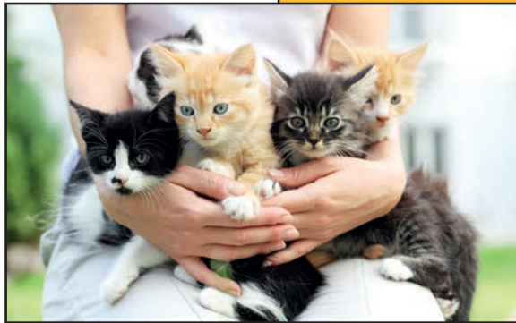
Zorgen voor onze dieren

Aan ons zwerfkattenbeleid werken we verder, waarbij we toezien op sterilisatie en identificatieverplichting.