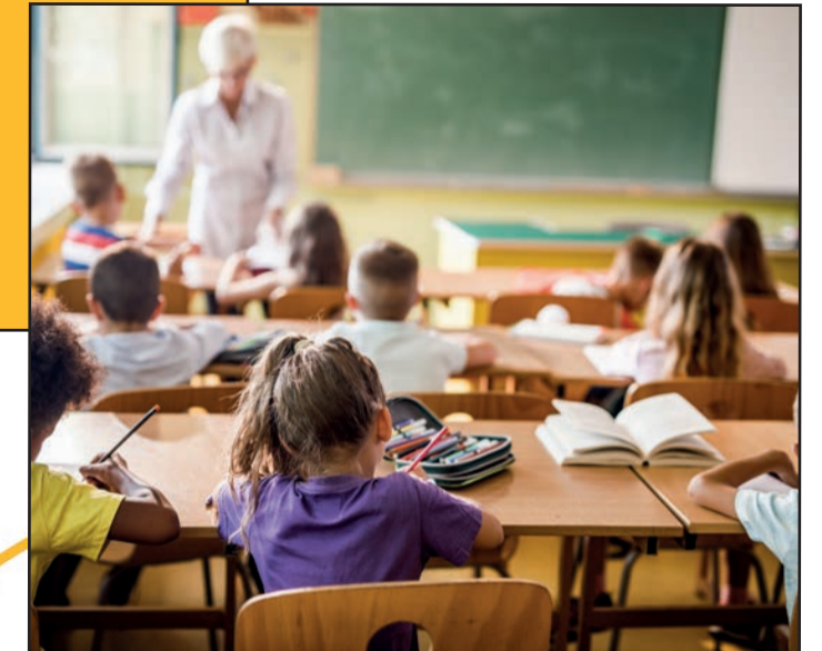
Scholen als motor voor gemeenschapsvorming

Onze gemeentescholen zijn een troef om te werken aan kwaliteitsvol en bereikbaar onderwijs voor elk kind, ongeacht de thuissituatie en rekening houdend met de capaciteiten van elk kind. We zorgen voor een sterke basis voor uw kinderen door hen in de scholen onze normen en waarden mee te geven.