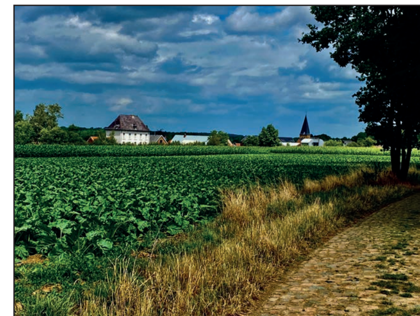
Pastorieën worden buurthuizen

De vergaderinfrastructuur voorzien we van multimedia-apparatuur . Van het Buurthuis in Nieuwrode maken we een volwaardige feest- en fuifzaal .