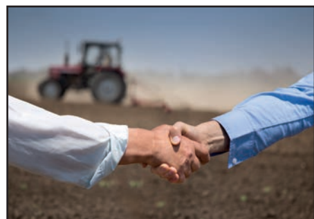
Plaats voor landbouwvoertuigen

We blijven ijveren voor voldoende openbaar vervoer en voorzien slim vervoer op maat met behulp van shuttles en taxi's. Voldoende fietsenstallingen en toegankelijke bushaltes mogen hierbij niet ontbreken.