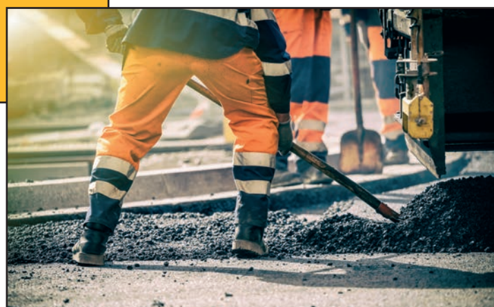
Activeren van mensen

Om uw welvaart in stand te houden, is een hoge werkzaamheidsgraad nodig, ook bij wie zich hier komt vestigen. Bij financiële moeilijkheden helpt de sociale dienst van het OCMW zoeken naar oplossingen. We bestrijden armoede niet door geld uit te delen, maar door mensen aan een vorming of job te helpen . Wie deel wil uitmaken van onze gemeenschap dient – als het fysiek mogelijk is – te werken of gemeenschapsdienst te doen.