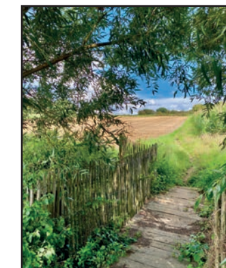
Zorgen voor onze groene gemeente

We stimuleren de aanleg van bos, kleine landschapselementen, klimaatbestendige tuinen, hoogstamboomgaarden en streekeigen beplanting . Waar mogelijk nemen we hierin zelf het initiatief.