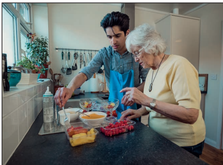
Zorg aan huis

Wie thuis woont en hulp nodig heeft, kan een beroep doen op het OCMW. We optimaliseren de werking van de huishoudhulp en gezinszorg , zodat de dienstverlening gegarandeerd blijft.