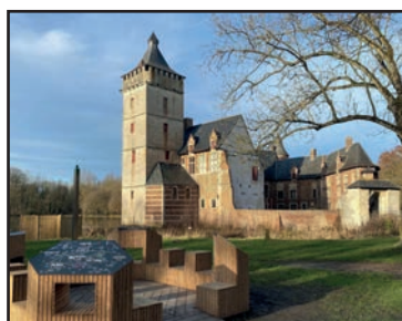
Toeristische troeven promoten

Onze cultuur en tradities houden we in ere. Met ons worden 11 juli, 11 november, Sinterklaas, Kerstmis en Pasen zichtbaar in het straatbeeld herdacht en gevierd. Jaarlijkse kermissen krijgen hun plaats in alle deelgemeenten.