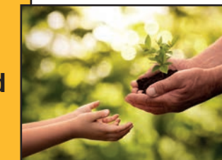
De toekomst van onze kinderen veiligstellen

We geven als gemeente het goede voorbeeld: eigen patrimonium en openbare ruimte leggen we klimaatbestendig aan met meer groene zones en minder verharding . We sensibiliseren onze inwoners rond rationeel energieverbruik, duurzame energiebronnen en collectieve energievoorzieningen. We zijn ambitieus, maar realistisch. Het moet haalbaar en betaalbaar blijven.