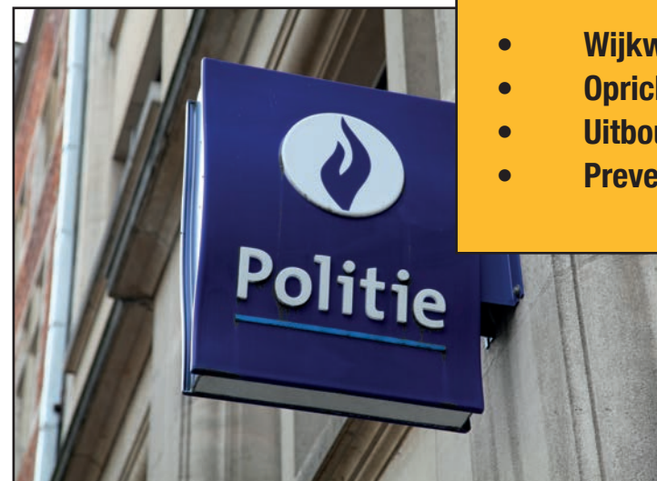
Wijkwerking lokale politie

Onze lokale politie is het best geplaatst om de gevoeligheden in de wijk aan te voelen en problemen op tijd te signaleren. Daarom zetten we volop in op de wijkwerking .