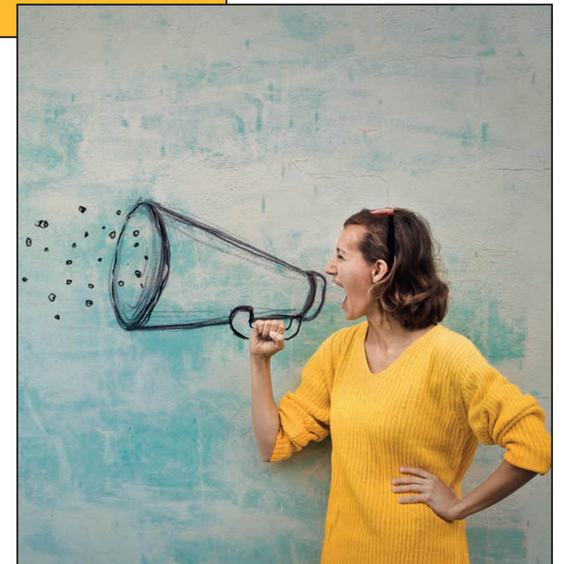
Informeren en communiceren

Naast een uitgebreid digitaal loket, optimaliseren we de loketwerking rekening houdend met werkende mensen, ondernemers en senioren .