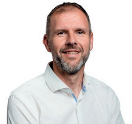
Eddy Merckx 11 de plaats

“ Naast de afwerking van het Ruggengraatproject is het tijd om de andere verbindingswegen en kleinere wegen in onze deelgemeenten aan te pakken. Door eenvoudige inrichting en duidelijke regels houdt iedereen zijn aandacht bij de weg. Een doordacht parkeerbeleid is nodig. ”