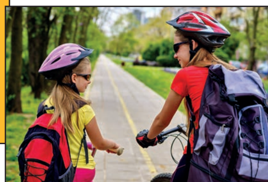
Meer veilige en aantrekkelijke zachte verbindingen