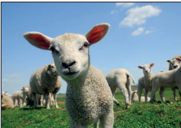
Informeren over onze dieren

We verspreiden actief huisdierstickers , die de hulpdiensten bij een interventie wijzen op de aanwezigheid van dieren.