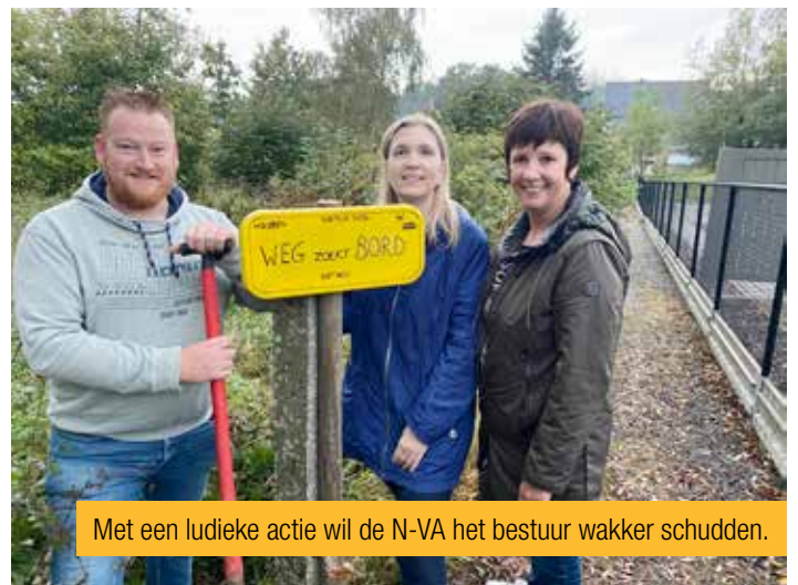
Met een ludieke actie wil de N-VA het bestuur wakker schudden.

De gemeente beweert een voorloper te zijn inzake een trage wegenbeleid en beloofde de Atlas der Buurtwegen in overeenstemming te brengen met het terrein. Sinds 2019 vraagt N-VA Holsbeek om bij de provincie geel-zwarte naambordjes te bestellen, die de provincie betaalt en levert. Op zo'n naambordje kan een wegnummer, een officiële naam en de deelgemeente geplaatst worden, samen met het logo van de provincie en de gemeente. In 2020 werd ons voorstel op de gemeenteraad weggestemd omdat het bestuur zelf bordjes zou laten ontwerpen. In meer dan de helft van Vlaams-Brabantse gemeenten staan de