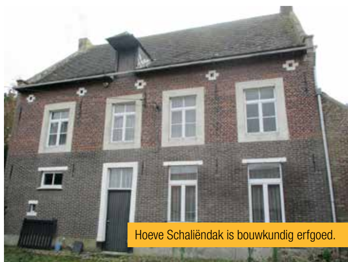
Hoeve Schaliëndak is bouwkundig erfgoed.

Er is in onze gemeente een inventaris bouwkundig erfgoed in opmaak. Erfgoed herinnert ons eraan dat we deel uitmaken van een ketting die verder spant dan ons leven. De unieke plaatsen tonen onze identiteit en bieden kwaliteit in onze omgeving. We zijn het aan onze toekomstige generaties verplicht om zorg te dragen voor onze waardevolle gebouwen en ze veilig te stellen voor de toekomst. De N-VA wees er al herhaaldelijk op dat ons gemeentebestuur te weinig aandacht besteedt aan ons erfgoed. En we zijn bijzonder teleurgesteld over de lijst die nu voorligt.