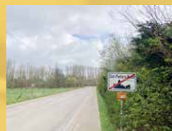
De heraanleg vanaf Sint-Pieters-Rode wordt op de lange baan geschoven.

Opnieuw openbreken voor het einde van de Ruggengraat in zicht is?